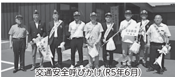
交通安全呼びかけ(R5年6月)