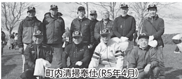
町内清掃奉仕(R5年4月)