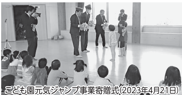
こども園元気ジャンプ事業寄贈式(2023年4月21日)