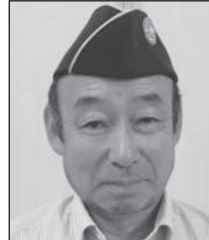
の と のぶよし L 能登 暢吉 2R 1Z