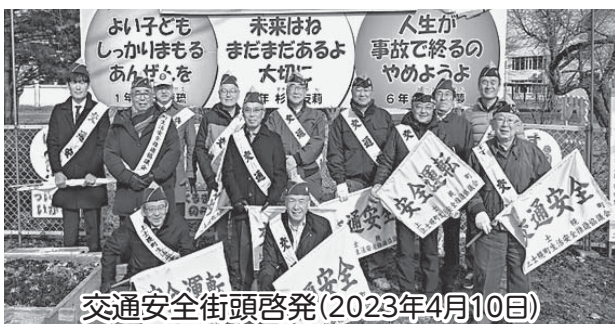
交通安全街頭啓発(2023年4月10日)