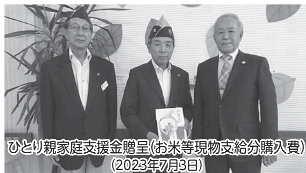
ひとり親家庭支援金贈呈(お米等現物支給分購入費) (2023年7月3日)