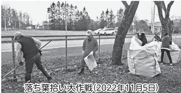
落ち葉拾い大作戦(2022年11月5日)

恒例のアクティビティは、特別養護老人ホーム「夏祭り」の「やぐら設置」(8月)、社会福祉協議会「ふれあい広場」での「餅つきコーナー」(10月)、神社公園の清掃と交通安全街頭啓発(10月)、特別養護老人ホーム「そば打ち昼食会」(11月)、年末チャリティーパーティー(12月)、新入学児童への防犯グッズの贈呈と交通安全街頭啓発(4月)などを実施しています。