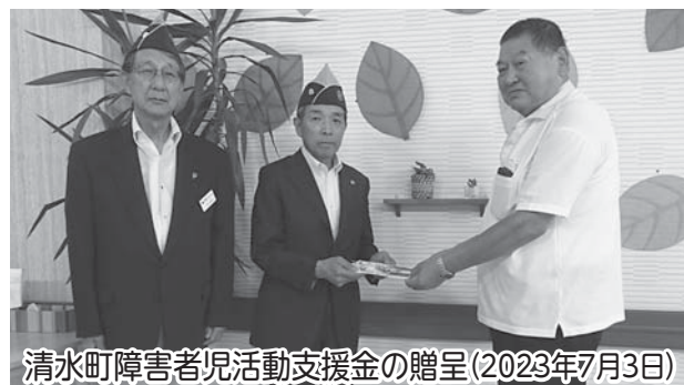
清水町障害者児活動支援金の贈呈(2023年7月3日)

今期の会長スローガンは「一歩ずつ明るい未来へ心の奉仕」です。クラブ会員の友愛のもと引き続き奉仕活動に取り組んで参りたいと思います。